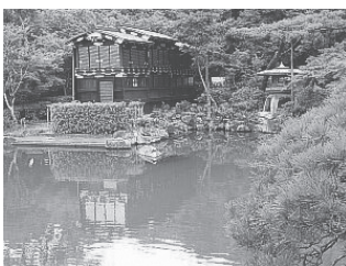
相楽園 姫路藩主の船屋形