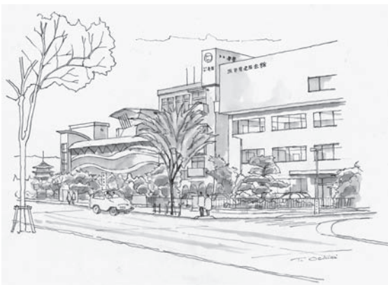
びわこホールやびわこ博物館が面するなぎさ通りのめぐまれた位置にある我が建築士会活動の拠点、建設会館あたりを画いてみました。落合輝夫