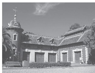
相楽園 小寺家 厩