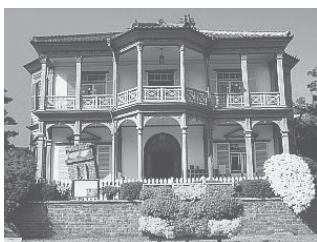
相楽園 ハッサム邸（公開中）