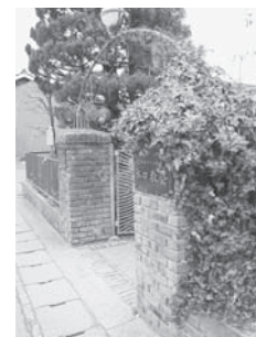
蔦の絡まる煉瓦積み門柱