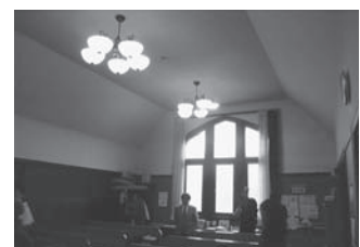
柔らかな光に包まれた礼拝室内部

教会入口の煉瓦積み門柱(登録有形文化財)も建設当時からのものである。教会に併設されている幼稚園の入り口でもあり、毎日元気な園児たちがヴォーリスの門(ゲート)をくぐりぬけてる。(竹田久志)