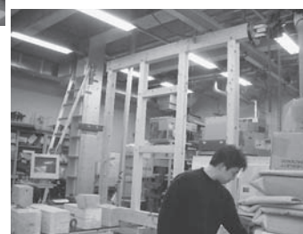
実物大試験体での実動台実験