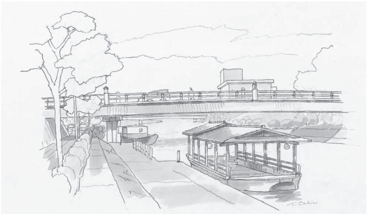
瀬田の唐橋のたもとで瀬田川名物あみ船が出番を待っている。 落合輝夫