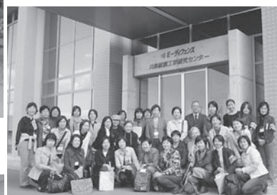
2007 近建女見学会 Eディフェンス