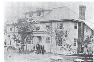
大正10年当時のダブルハウス外観 〔住まい学大系/011 ヴォーリスの住宅、著者：山形政昭、発行所：住まいの図書館出版局〕より引用

イギリスでは1860年代から、住宅建設ラッシュが始まり、産業革命の進展によって中流階級住宅が要求された。この動きはドメスティックリヴァイヴァル(=住宅復興運動)と呼ばれ、この中で中流階級の新しい生活像“職住分離”を反映した生産者住宅を求める実験が繰り返されることになったのである。イギリスでは、ダブルハウスの様な2軒1棟や3軒1棟の住宅が多く残っている。近江八幡においても、近江兄弟社の社員住宅として、ミニマムサイズで二重レンガ壁(界壁)を境に2軒の住宅を背合わせにしながら、快適性と機能性を工夫した巧みなプランニングでまとめられている。例えば、居間と食堂の仕切りは大きな四折戸で、夏は開けると風通しの良い涼しい広間になる。冬は閉めると北側の台所の冷気をシャットアウトでき、南東側から直射日光を取り込み、暖かく過ごすことができる。