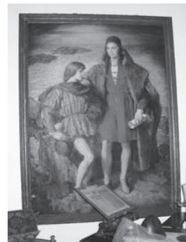
コロンブスとその息子ディエゴの肖像画である。