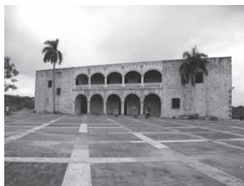
1000ペソ紙幣の背面のデザインにも採用されている。

コロンブス家が3代に亘って住んでいたという私邸である。2階建ての建物で現在は博物館(有料)になっている。2階の東側のテラスからはオサマ川が見渡せる。使われていた食器類、彼等が寝室として使用していたベッドなど彼等の当時(16世紀当初)の生活ぶりが伺える。私の大発見は、コロンブスとその息子ディエゴの2人揃った肖像画である。そして建物の前はいろんな催しが開かれる大きな広場になっている。その名はスペイン広場。1000ペソ紙幣(裏面)のデザインにも採用されている由緒ある建物である。余談であるが1000ペソ紙幣の表は大統領官邸(palacio nacional パレシオ・ナショナル)がデザインされている。