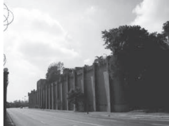
東はオサマ川である。東からの眺めはまさに要塞そのものようだ。