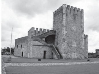
防衛の拠点に相応しい石造りの頑強な建物は 500 年の齢を重ねる。

石造の建物は当時の面影を残し最上階からの眺め、特にオサマ川の眺めは絶景である。高さ 18m、当時は最も高い建物であった。市内を一望できる。当時の建築技術が垣間見られる。