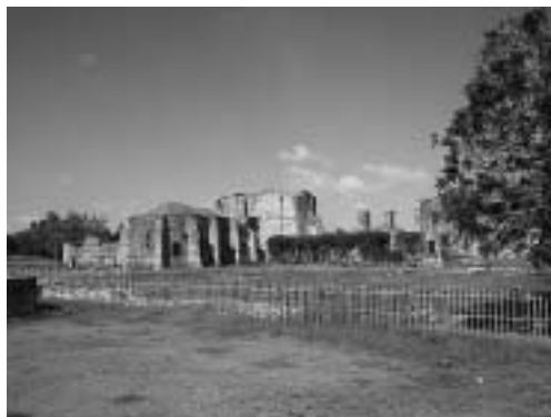
周囲はフェンスで囲まれ市民の憩いの場でもある。復旧されるときっと素晴らしい名所となるだろう。

アメリカ大陸最初の修道院は1513年建設された。さまざまな変遷を経て現在見る無残な姿となっている。その原因はどうかや地震である。教会でもあり病院でもあった。今は時折コンサート等にも利用されることがある。想像以上に多様に利活用はされている。いつの日か元の修道院に生まれ変わると信じている。本当に広大だ。まわりはフェンスで囲まれておりちょうど公園のようだ。