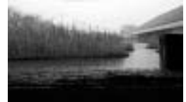
楽吉左衛門館茶室 広間から見える景色 (冬)