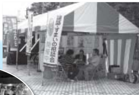
昨年のフェスティバルの様子