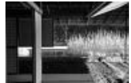
楽吉左衛門館茶室 広間から見える景色 (初夏)