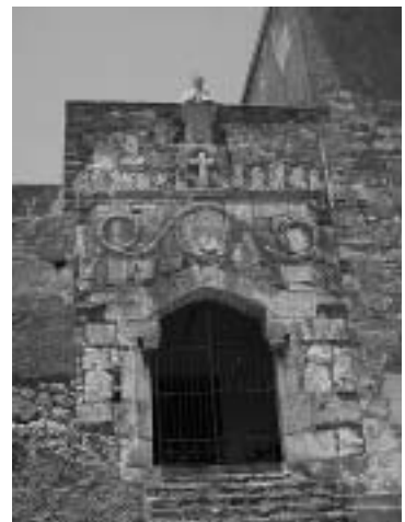
修道院を彷彿させる丁部の人物像、その下の十字架が修道院の痕跡を残す。