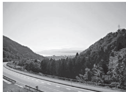
春から夏にかけての追坂峠の風景 雪に覆われた追坂峠の風景