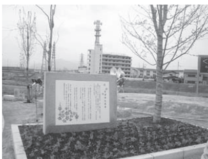
草津市桜憲章記念碑と桜憲章広場