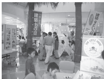
「建築士の日」の事業

また現在、改正後現場での対応が難しくなった鉄骨に関する勉強会を行う事が決定しており、日程及び内容等の調整を行っています。詳細が決まり次第ご案内をさせていただきます。