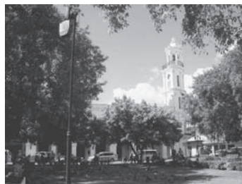
観光の拠点コロンプス公園(パルケ・コロン)の西に位置する。東側から

角にあるこの建物をどう活用するのか模索しているようにも見える。コロンプス公園の周りにはこうした建物のほか、大聖堂、カフェテリア、土産物店、ホテル、観光案内所もある。