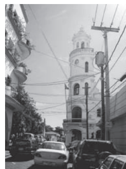
無秩序な電柱や電線と車、ここはいつも大勢の観光客で賑わう。北側から