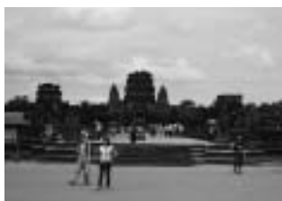
2002年ゴール地 アンコールワット

2004年はバンコクから北上し、ラオス・ヴィエンチャンゴール2,900kmである。あきんど号はロックセクションでフロントショックの上部がはずれ、それがオイル