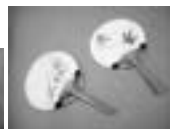
みんなでオリジナルうちわを作ろう!