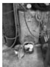
アセチレンガス発生装置