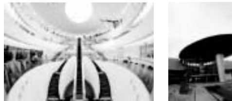
建築家 黒川紀章 氏 設計の迫力の空間!