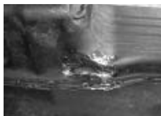
裂けたオイルパン