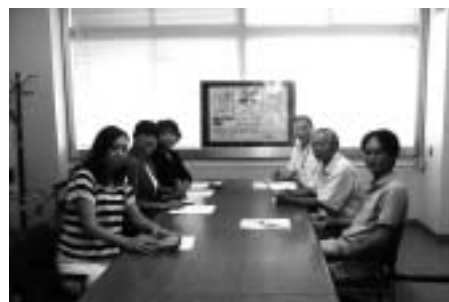
県立安曇川高校会議室にて

「かばたのある地域の暮らしを具現化してみようよ」から始まった実建築プロジェクトです。実建築をめざす過程も実建築後も、教育の場にとって、地域の人と自然と暮らし・まちづくりにおいて、有意義なプロジェクトとなるべく、活動していきます。ご協力よろしくお願ひします。