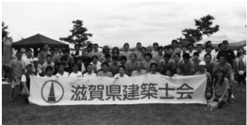
今年も沢山のメンバー、応援団が集まりました。