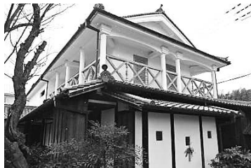
旧九鬼家住宅資料館