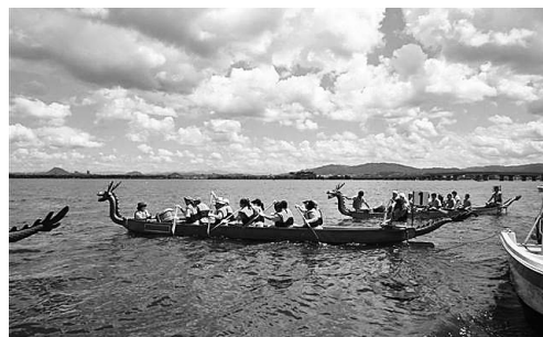
女性委員会、初参戦

第22回びわこペーロンに初参戦しました。滋賀県建築士会女性委員会を中心となり近畿女性建築士協議会の協力も得て、滋賀から19名、京都6名、大阪4名、兵庫2名、奈良4名、和歌山3名、総勢28名の近畿女性建築士が集結しました。チーム名は「(公社)滋賀県建築士会女性委員会with近建女」、2レースの合計タイムを競う10人漕ぎの部にエントリーしました。何事も初めてづくしで練習もままならぬ状況でしたが、夏の青空と会場の熱気に気分も高揚し、近建女の団結力の良さもあいまってやる気満々で挑みました。1レース目は、みんなの応援もあって見事完走出来ました。記録ではなく、記憶に残る素晴らしいレースでした。2レース目は、ゲリラ豪雨に見舞われ、残念ながら中止となりました。以後は、青年委員会が準備して下さったBBQ大会で大いに盛り上がりました。