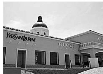
神戸三田プレミアム・アウトレット

募集定員 40名 (会員及び会員家族) ※ただし、締切日前でも定員になり次第締め切ります。 【締切10月20日(土)】