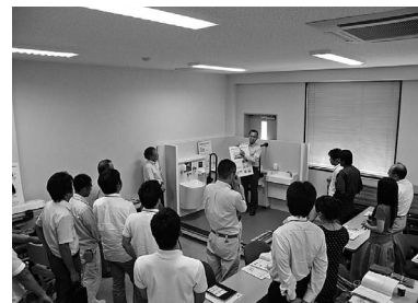
TOTOセミナー：草津会場