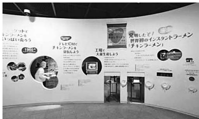
インスタントラーメン発明記念館

場 所 大阪・神戸方面 (インスタントラーメン記念館、旧九鬼家住宅資料館、神戸三田プレミアム・アウトレット)