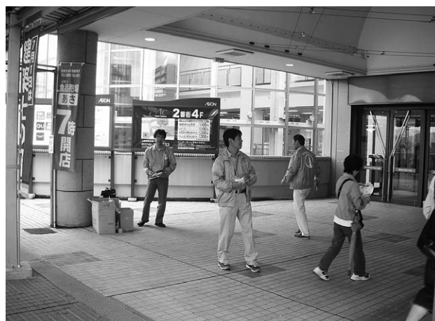
昨年の活動の様子