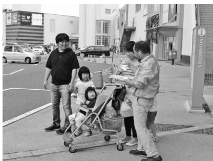
市民との触れ合いの様子