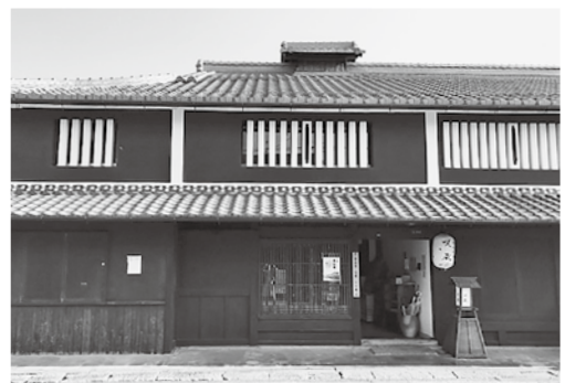
守山宿・町家“うの家”

※滋賀県建築士会HP http://www.kentikushikai.jp/ 【参加申込】からもお申込み頂けます。