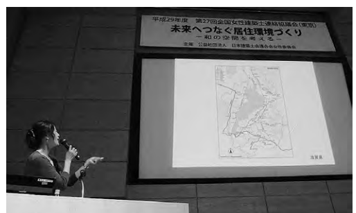
ワン・バイ・ワン 滋賀のスピーチ