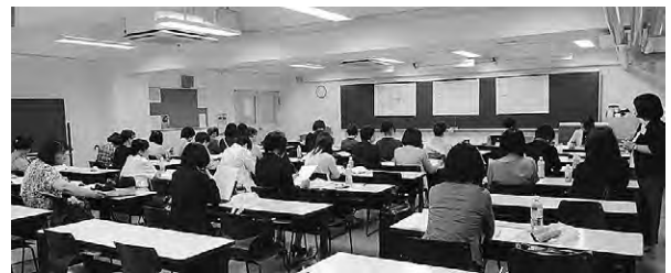
意見交換・情報交換する参加者たち

2報告共、継続し積み上げていく活動で、しっかりと地域に根ざしており、住人、行政、他団体との連携を生み、建築士のアピールにも繋がっています。私達にもこのような活動が出来ればとの思いを抱きました。