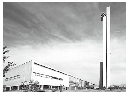
フジテック(株)ビッグウイング