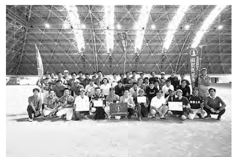
表彰式後の参加者たち