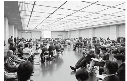
ディスカッション