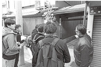
六原地区での活動の説明を受ける