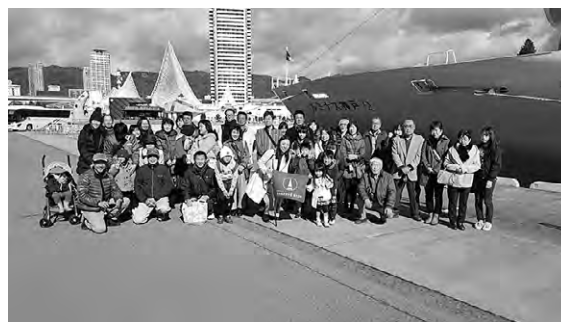
個性的な神戸の街並みを背景に