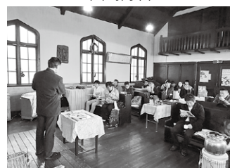
ヴォーリス堅田教会