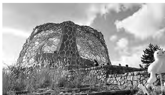
自然体感展望台 六甲枝垂れ